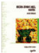
'Begira zenbat argi, maitea' Egilea: Annie Ernaux. Ilustratzailea: Xabier Aranburu. Argitaletxea: Igeia.

Nola edo hala, supermerkatuaren soziologiarako ohar laburtzat har daitezke oharrok, aro postmodernoren espazio esanguratsua baita zentro komertziala: horrek bizitza garaikidean daukan zeresana iradokitzen du Ernauxek. «Idatz liteke –esaten du– bizikontakizunik, noski, maizen joaten garen saltoki handietan barrena ibiliz». Halako kontakizun go-goangarria da, adibidez, F. Ozonen Sous le sable filmeko sekuentzia, zeinetan protagonista superreko pasilloetan promena-