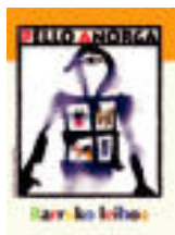
'Barruko leihoa' Idazlea: Pello Añorga. Ilustratzailea: Jokin Mitxelena. Argitaletxea: Pamiela.

Ezin aipatu gabe utzi ilustrazioek duten indarra, sarrin ondoan dituzten poemak baino indar poetiko handiagoa erakusten dutela iruditu zait niri. Badaitort, liburua zabaldu eta han azaltzen zaigun paisaiari so eman dudana denbora neurtzeko erlojurik ez da sortu.